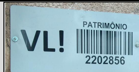
Acima: ruínas do Complexo Ferroviário das oficinas, abandonado; ao lado: placa patrimonial na entrada das oficinas.