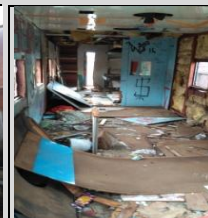
Acima: computadores e impressoras destruídas; vagões abandonados; vagão da turma de manutenção deprecado.